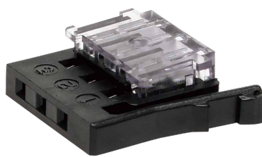
PRS-3CN-2628N 標準価格(税抜) 1,400円(10入)