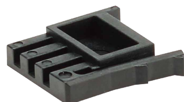
PRS-3CN-0101 標準価格(税抜) 770円(10入)