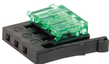
PRS-3CN-2224N 標準価格(税抜) 1,400円(10入)