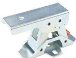
高さ40mm 標準価格 380円/個 (税抜・販売単位 50)