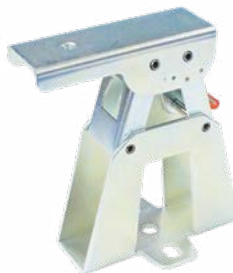
高さ75mm 標準価格 440円/個 (税抜・販売単位 20)