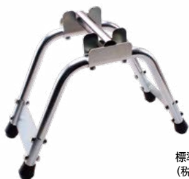
標準価格 15,280円 (税抜・販売単位 1)