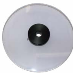
標準価格:17,140円 (税抜・販売単位 1)