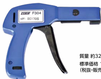
質量 約320g 標準価格 16,200円 / 個 (税抜・販売単位 1)