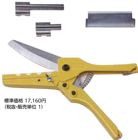
標準価格 17,160円 (税抜・販売単位 1)