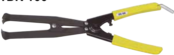
標準価格 17,610円 (税抜・販売単位 1)