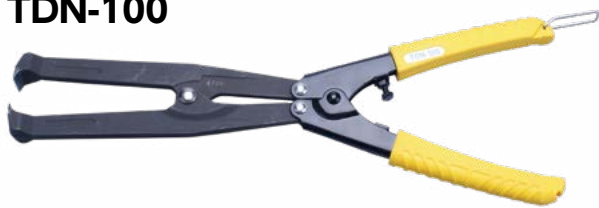
標準価格 20,590円 (税抜・販売単位 1)