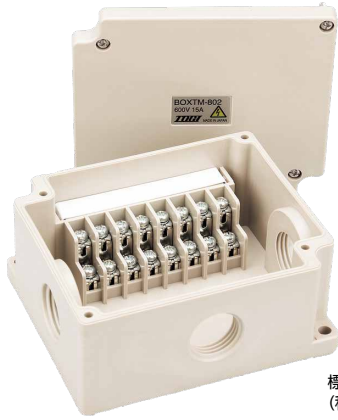
標準価格 2,450円 / 個 (税抜・販売単位: 1)