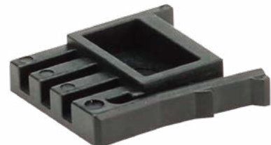
PRS-3CN-0101 標準価格(税抜) 960円(10入)