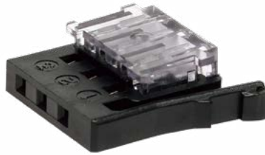
PRS-3CN-2628N 標準価格(税抜) 1,870円(10入)