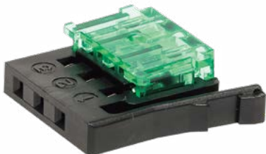
PRS-3CN-2224N 標準価格(税抜) 1,870円(10入)