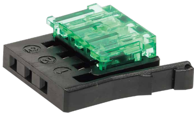
PRS-3CN-2224N 標準価格(税抜) 1,400円(10入)