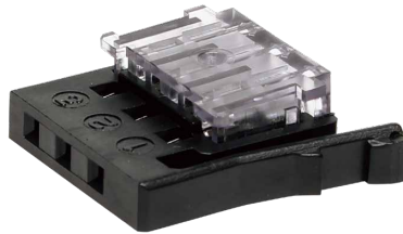
PRS-3CN-2628N 標準価格(税抜) 1,400円(10入)